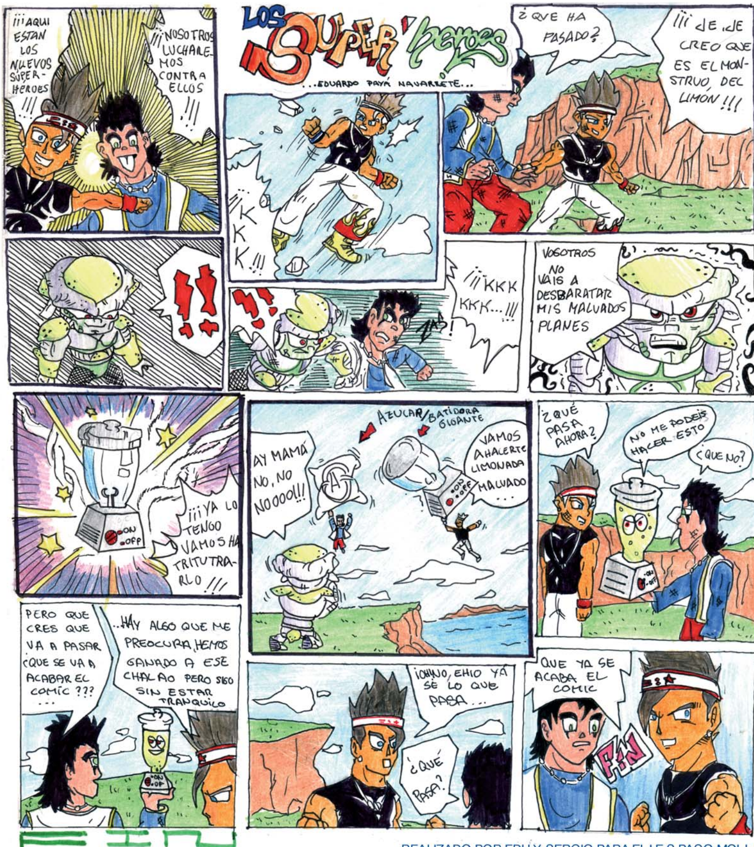
REALIZADO POR EDU Y SERGIO PARA EL I.E.S PACO MOLLÀ